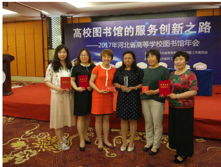
图书馆获奖同志在领奖现场合影

河北省高校图书馆服务创新案例大赛是由河北省教育厅、河北省高等学校图书情报工作委员会主办的河北省高校图书馆系统的最高级别专业赛事。本次大赛共有全省高校的63个案例参赛，河北科技师范学院代表队通过PPT、海报等形式生动形象地展现了图书馆在人才培养、信息服务、阅读推广等工作中的创新成果，展示了图书馆工作人员的业务能力和精神风貌，进一步促进了图书馆服务水平的提升。