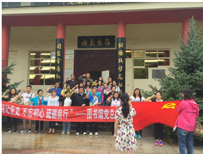
全体人员在花场峪抗日纪念馆前宣誓

通过主题党日活动进一步坚定了党员同志们的共产主义理想信念，更加牢记对党作出的庄严承诺，立足岗位发挥先锋模范作用，无愧于共产党员的光荣称号。新老党员和积极分子均表示，今后要更加认真学习，努力工作，用实际行动为党旗增光添彩。